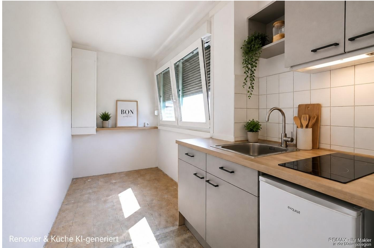
Renovier & Küche KI-generiert

RE/MAX - Ihr Makler in der Metropolregion