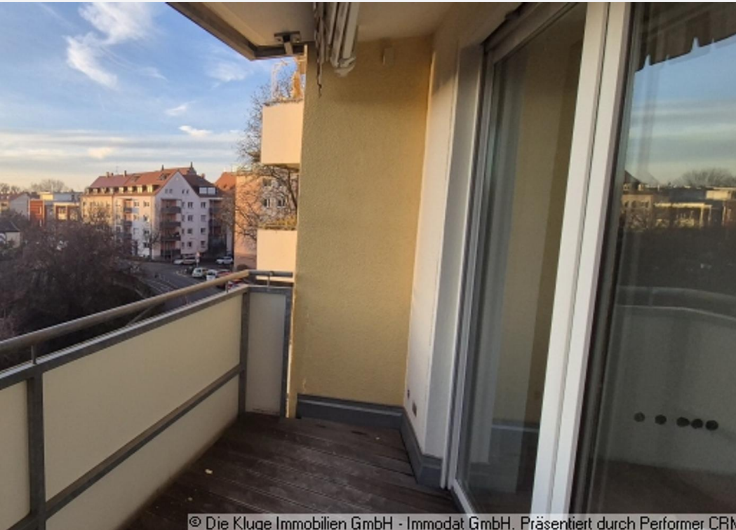
© Die Kluge Immobilien GmbH - Immodat GmbH. Präsentiert durch Performer CRM