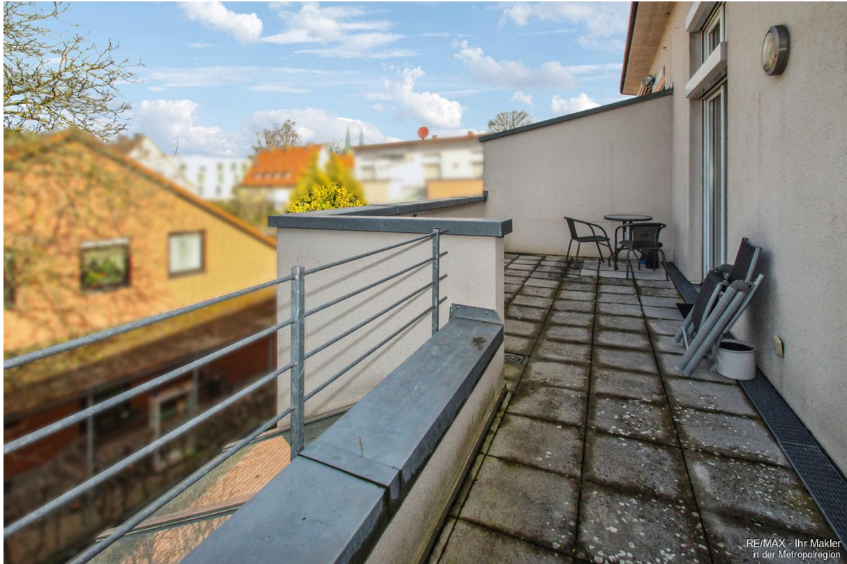
RE/MAX - Ihr Makler in der Metropolregion