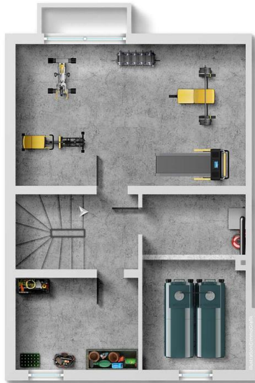
Exposéplan, nicht maßstäblich