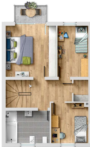
Exposéplan, nicht maßstäblich