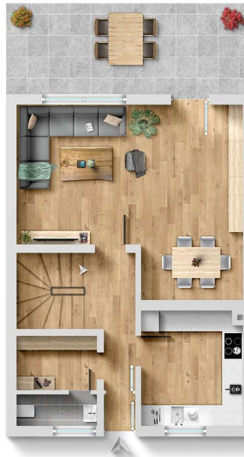
Exposéplan, nicht maßstäblich