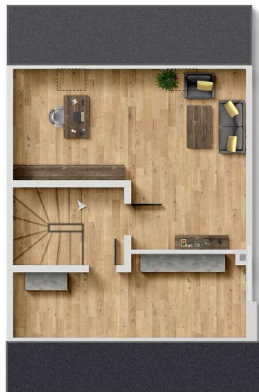
Exposéplan, nicht maßstäblich