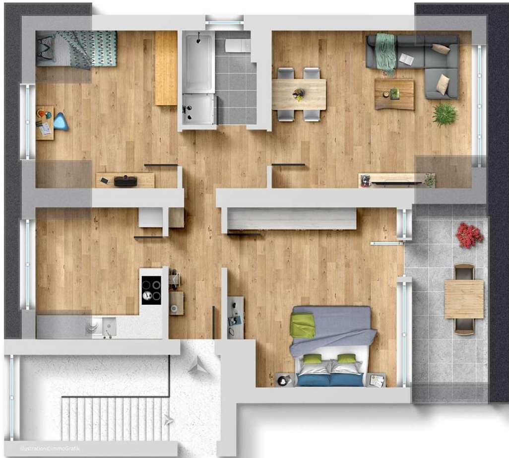
Illustration © ImmoGrafik