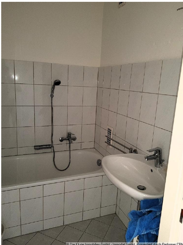
© Die Kluge Immobilien GmbH - Immodat GmbH. Präsentiert durch Performer CRM