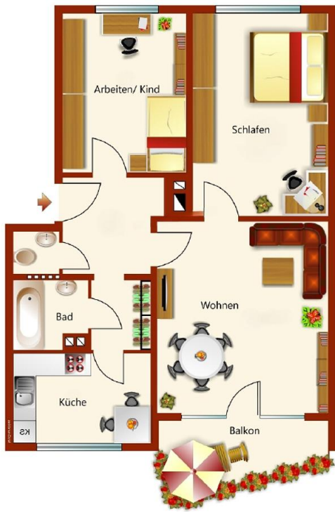
© Die Kluge Immobilien GmbH - Immodat GmbH. Präsentiert durch Performer CRM