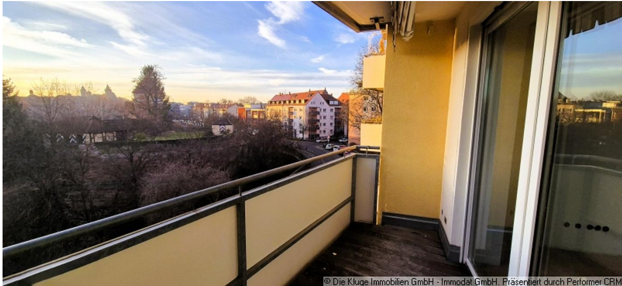
© Die Kluge Immobilien GmbH - Immodat GmbH. Präsentiert durch Performer CRM