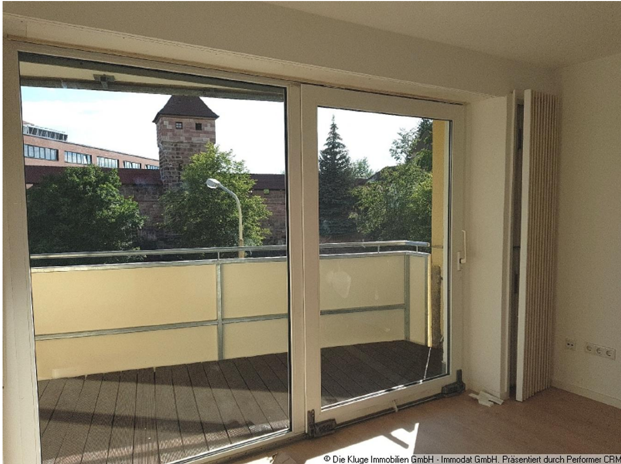
© Die Kluge Immobilien GmbH - Immodat GmbH. Präsentiert durch Performer CRM