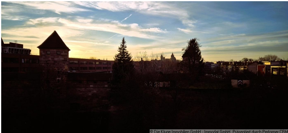
© Die Kluge Immobilien GmbH - Immodat GmbH. Präsentiert durch Performer CRM