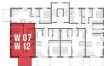
ERDGESCHOSS / 1. OBERGESCHOSS

Highlights: Viel Stauraum Südbalkon Abstellraum